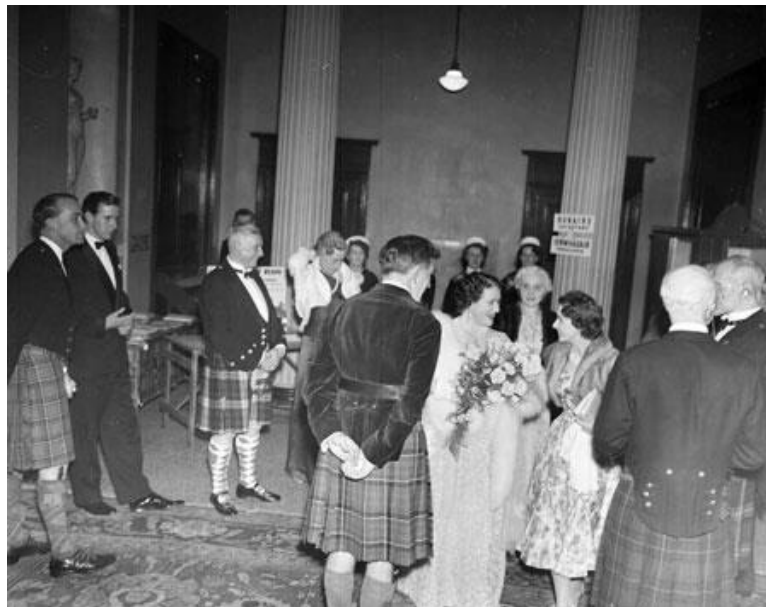
Ìomhaigh 2: Màthair na Bànrigh agus A' Bhana-phrionnsa Màiread a' nochdadh aig Talla Ciùil Obar Dheathain airson Mòd Nàiseanta 1955

Thug Baile-mòr Obar Dheathain aoigheachd don Mhòd Nàiseanta ceithir uairean, 1946, 1955, 1964 agus 1976.