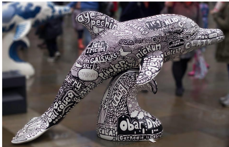
Ìomhaigh 1: 'Carnegie' leis an neach-ealain 'Gabrielle Reith

faclan an uairsin a thionndadh gu bhith na obair-ealain leis an neach-ealain ionadail Gabrielle Reith.